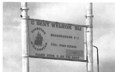
Welkom in Willemstad

Jammer dat er boten waren die eerder afhaakten en hun