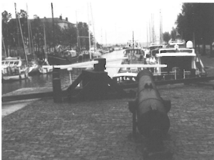
Saluutschoten bij aankomst in Hellevoetsluis

Het Voorjaar zeilweekend met de Hemelvaart is een lekker stukje zeilen geworden. Alle ingrediënten voor sportief zeilen waren aanwezig.